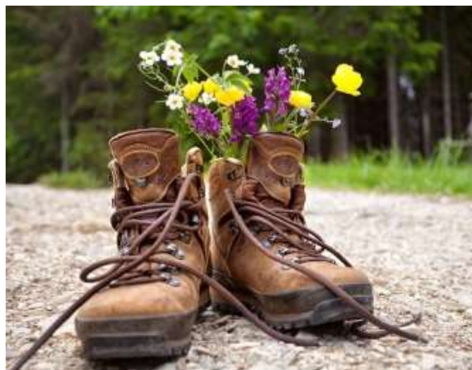
Solkan, april 2024

Posamezne vsebine (splošna kondicijska priprava, atletika, igre z žogo, badminton,...)